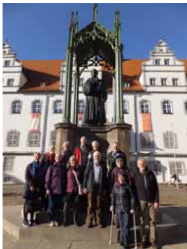
Gruppenbild mit Martin Luther.