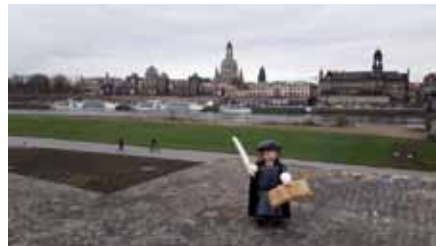
Eine der ersten Einsendungen

Ach ja, eine Preisverleihung soll es zum Jahresende 2017 auch geben. Lassen Sie sich überraschen!