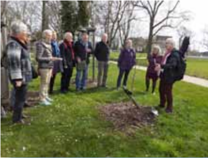
Im Luthergarten in Wittenberg. Kirchenvertretungen und Gemeinden aus aller Welt pflanzen hier Bäume als Zeichen der Ökumene, auch der Taizé-Singkreis.

Wir dürfen auch bei Rückschlägen nicht müde werden, die Ökumene voranzutreiben!