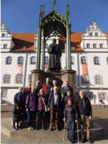
Gruppenbild mit Martin Luther.