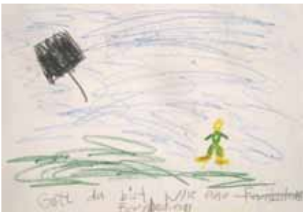
Kinderbild: Gott ist wie eine Fernbedienung