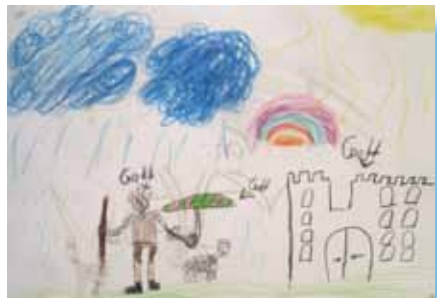
Kinderbild: Gott: Hirte mit Stab; Schirm, Burg